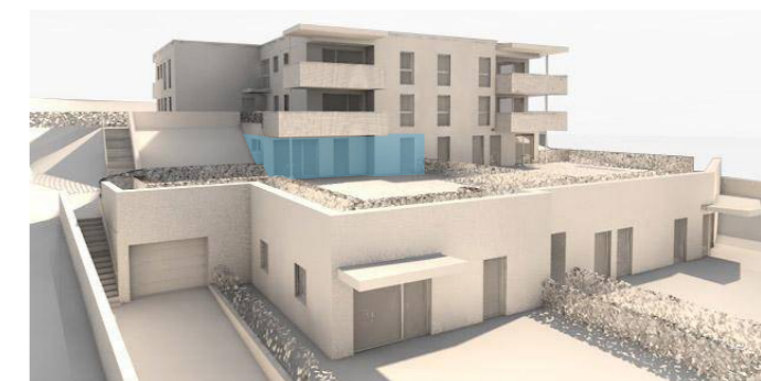
lage im gebäude